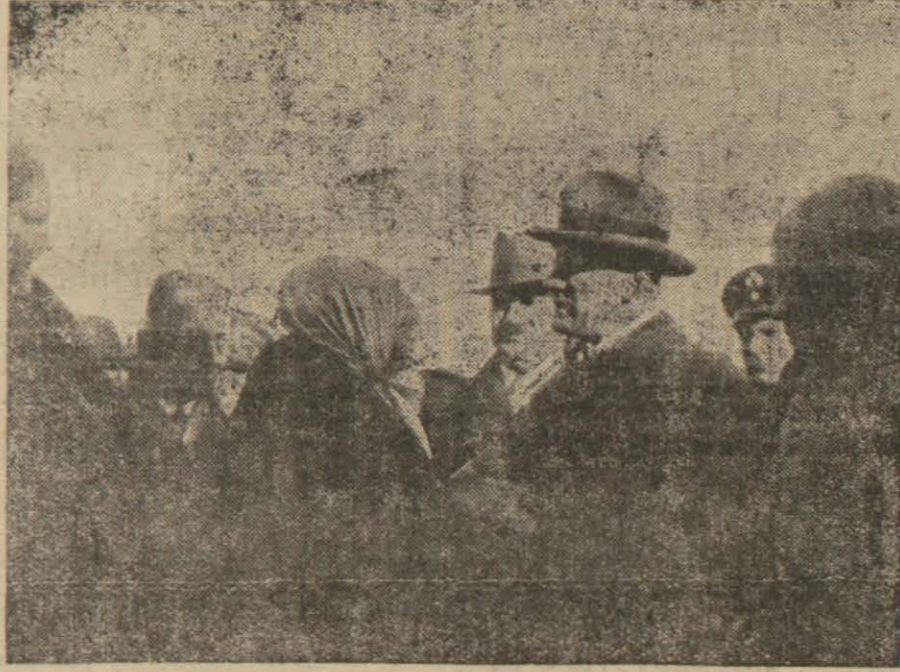
Atatürk Budunun Dileklerini Dinlerken

Sayı Namzedleri 7 Şubatta Atatürk'ün Beyannamesile İlân Edilecek. müstakil namzedlere de Yer veriliyor.